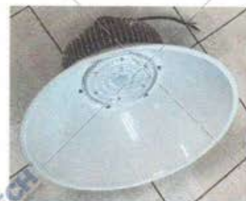
Hình 2: Mẫu thử

TRƯỞNG PHÒNG THỬ NGHIỆM ĐIỆN, ĐIỆN TỬ VÀ HIỆU SUẤT NĂNG LƯỢNG